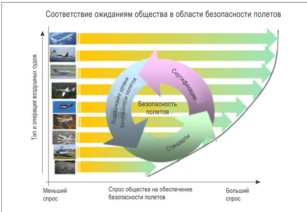
Рис. V-7-C-2. Пример соответствия ожиданиям общества

Упомянутые выше два аспекта показаны на рис. V-7-C-2.