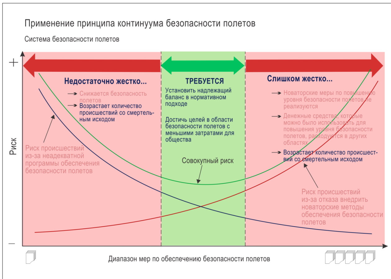
Рис. V-7-C-4. Пример применения принципа континуума безопасности полетов