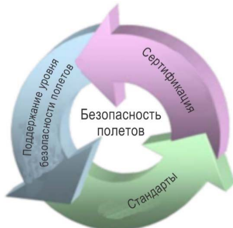
Рис. V-7-C-1. Базовая концепция континуума безопасности полетов

Чтобы понять концепцию континуума безопасности полетов, представляется полезным описать, чем она не является: