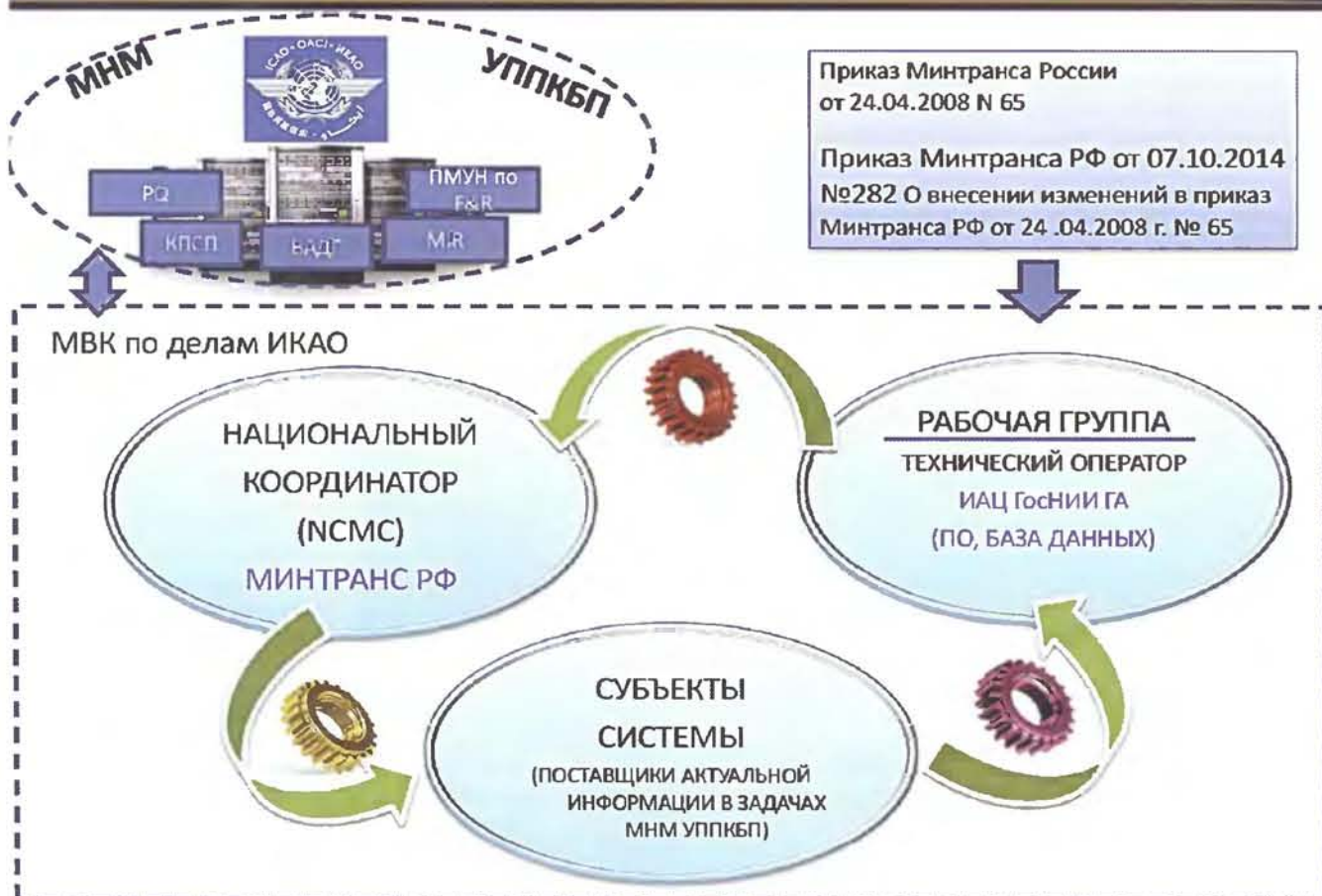
СХЕМА РЕАЛИЗАЦИИ СИСТЕМЫ ОБЕСПЕЧЕНИЯ ФУНКЦИОНИРОВАНИЯ МНМ УППКБП В РФ