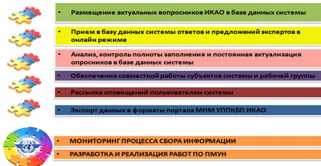
Рис. 2. Функционал системы информационного мониторинга безопасности авиационной деятельности (СИМБАД)

Анализ стандартов и рекомендуемой практики ИКАО в вопросах МНМ УППКБП применительно к задаче построения и ввода в практическую эксплуатацию СИМБАД в целом определяет следующий функционал (рис. 2), достаточный для эффективной реализации в Российской Федерации задач МНМ УППКБП.